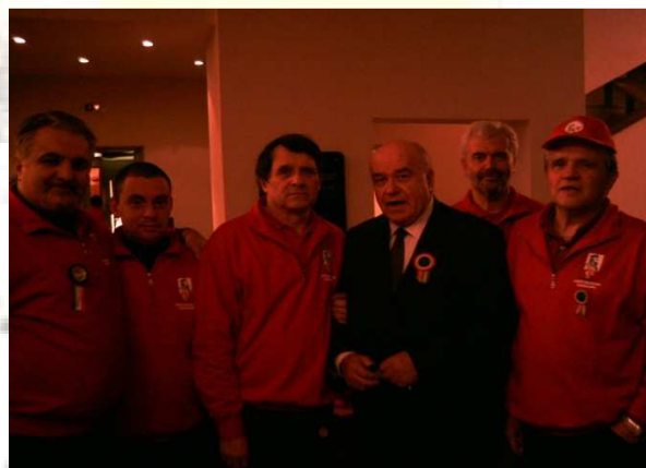
Il Sen. Valerio Zanone tra i volontari del corpo garibaldini il 6 novembre 2010 a Bergamo