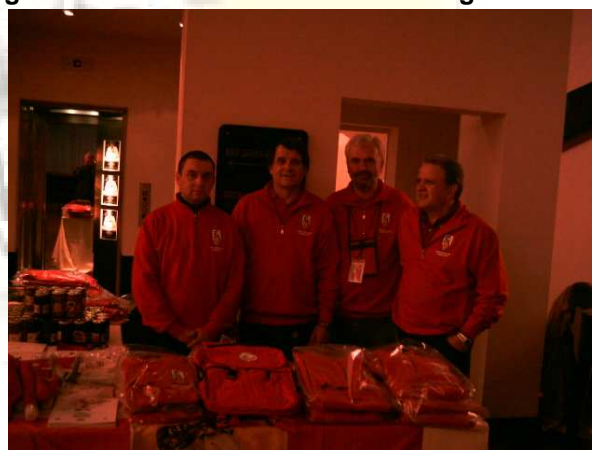
Lo spazio del CVG a Bergamo il 6 novembre 2010