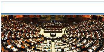
La CAMERA nel

CONOSCIAMO PIU' DA VICINO LE NOSTRE ISTITUZIONI, ALLA LUCE DEGLI ULTIMI AVVENIMENTI