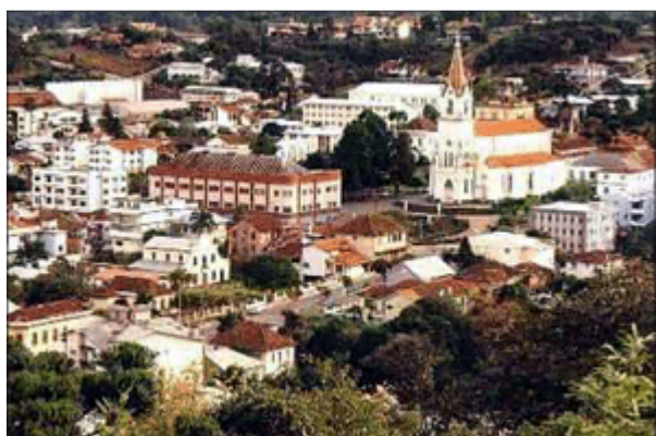
Città di GARIBALDI nello stato di Rio Grande do sul in Brasile